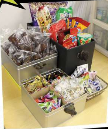
無料お菓子コーナー